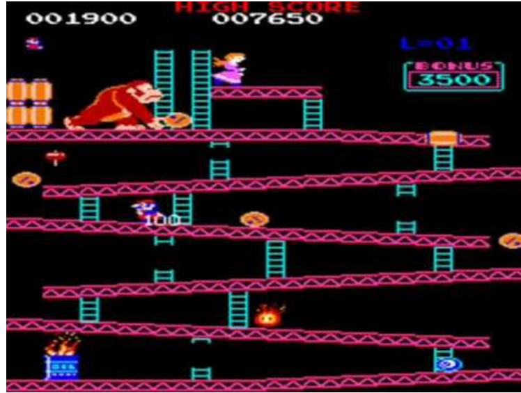
لعبة ال Donkey Kong ٢

برزت الرياضة الإلكترونية في بداية الثمانينات، خاصة بين عامي ١٩٨١ و ١٩٨٣، حيث بدأ بعض اللاعبين الاميركيين بممارسة لعبة ال Donkey Kong، بشكل احترافي ومقابل بدل وعبر نقل هذه المباريات عبر التلفاز ١ . لكن كان يقتضي الانتظار لغاية بداية التسعينات لمشاهدة مباريات الكترونية على المستوى الدولي.