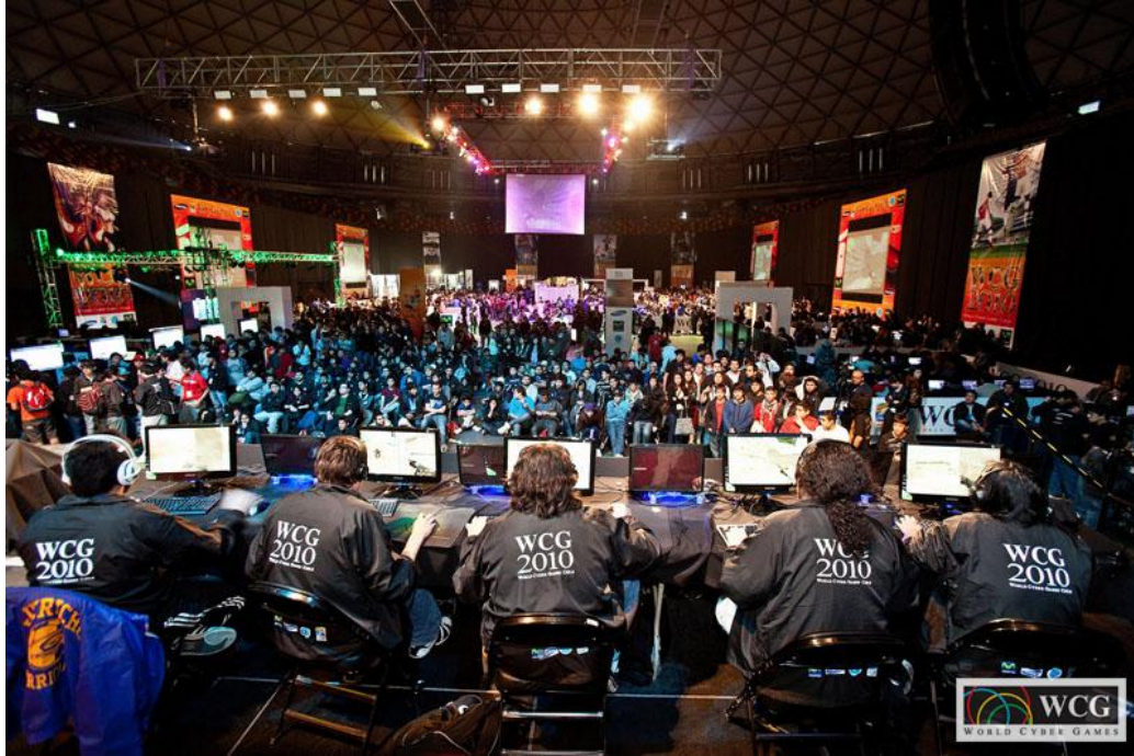
مصوّر متوافر عبر الشبكة 3

في العام ٢٠٠٠، افتتحت كوريا الجنوبية، المعتبرة مرجعاً اليوم للرياضة الإلكترونية، الألعاب السيبرالية العالمية (World Cyber Games WCG)، التي توازي الألعاب الاولمبية للعبة الإلكترونية، ويصار الى دعوة اللاعبين من أكثر من سبعين بلد سنوياً، للاشتراك في المباريات الفردية والجماعية في مختلف انواع الألعاب الإلكترونية (من العاب حركة، رياضة، قتال، اطلاق نار او غيرها...) وتتنقل على شاشات عملاقة. وبالتوازي، اطلقت فرنسا عام ٢٠٠٣ كأس العالم للاعاب الالكترونية (Electronic Sports World Cup ESWC).