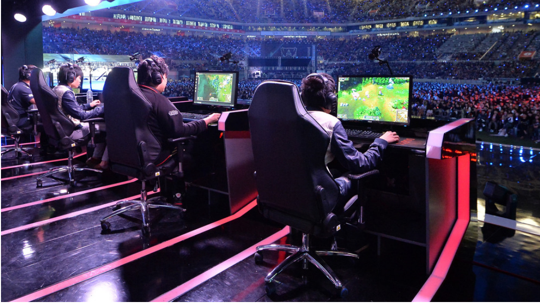
مصور متوافر عبر الشبكة ٧

انطلاقاً من ما تقدم، يكون من الضروري تحديد اي مباراة يمكن وصفها بالرياضة الإلكترونية. بالنسبة للبعض، يجب ان تكون الرياضة الإلكترونية مطوّرة او مكتوبة من قبل شخص خاص وتجمع اقله لاعبان ٨ . لكن هذا الشرط ليس كافياً، اذ يبقى من الضروري ان يصار الى تنظيم مباريات التي تسمح بتمويل لاعبين محترفين من قبل تجار ومعلنين. وهنا تبرز اهمية تحديد الاطار القانوني لهذا النوع من التمويل كما ونظرية الفريق، ضرائبية الارباح والاقساط.